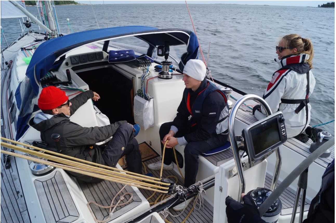
En del av s/y Xantus besättning på Barösund Runt 2020

På årsmötet 2020 beslöts det att hålla medlems-, inskrivnings-, besiktnings- och lägeravgifterna oförändrade: