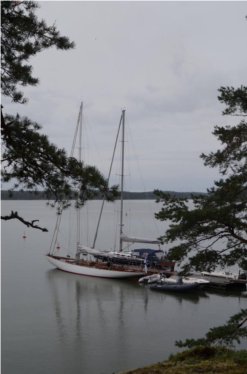
S/y Kitty och s/y Xantus vid bryggan på Skämmö